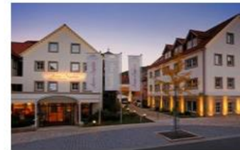
KÜNZELSAU - 49 ZIMMER HOTEL ANNE-SOPHIE