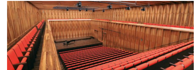
Reinhold Würth Saal