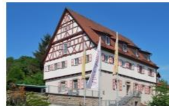
AILRINGEN - 15 ZIMMER AMTSHAUS