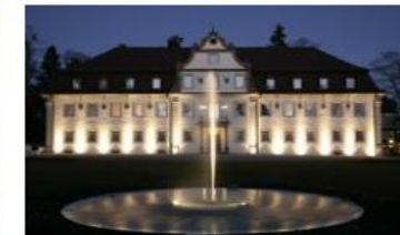
FRIEDRICHSRUHE - 66 ZIMMER WALD & SCHLOSSHOTEL

Neben den Würth-Hotels stehen Ihnen zahlreiche weitere Hotels in der Umgebung zur Verfügung. Unsere Hotel-Buchungszentrale unterstützt Sie gerne bei der Unterbringung Ihrer Veranstaltungsgäste: Telefon: + 49 7940 15 1050, Email: hotels@wuerth.com .