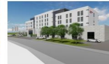
WALDENBURG - 120 ZIMMER PANORAMAHOTEL