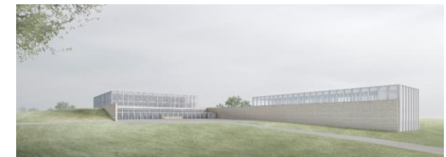
Konferenzbereich mit Museum