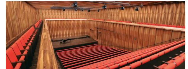
Reinhold Würth Saal